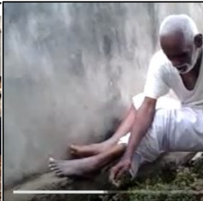
సార్ దాదాపు 10సం||లు ప్రతిరోజూ తిన్న ఆకుకూర