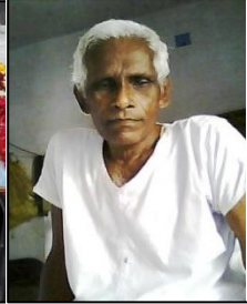
సార్ ఇంటిలో నిరామయంగా