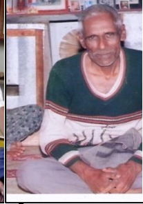
శ్రీ సాయి మాస్టర్ నిలయంలో సార్