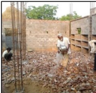
శ్రీ సాయి మాస్టర్ నిలయం 2 నిర్మాణం