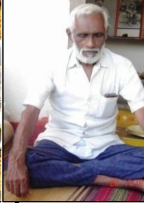
శ్రీ బ్రహ్మాంగారి మఠంలో సత్సంగం తరువాత ధ్యానం