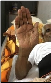
అభయమిస్తు న్న సార్