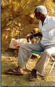
శ్రీ సాయి మాస్టర్ విద్యాలయ నిర్మాణ పర్యవేక్షణ