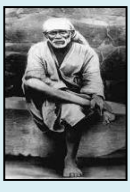
శ్రీ శ్రీ సాయిబాబా